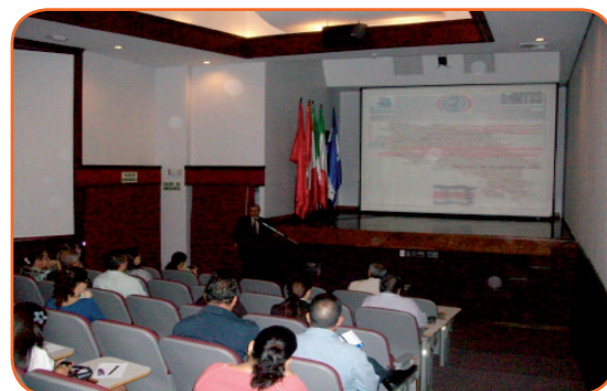
Funcionarios y funcionarias del MTSS asistieron a la Defensoría de los Habitantes para ser capacitados en materia de Migraciones Laborales.

En aras de seguir trabajando y por el momento de oportunidad que ha impulsado la Dirección General de Migración y Extranjería, consecuentes con los esfuerzos que se realizan desde el MTSS para gestionar una