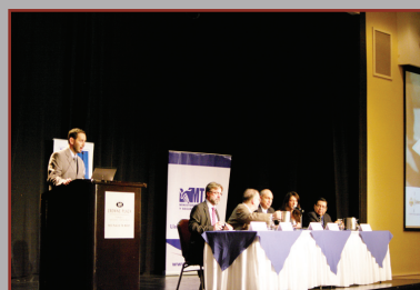
Expertos internacionales y autoridades del MTSS fueron parte del Seminario Internacional.

Costa Rica realizaron el Seminario Internacional: Reflexiones en torno al Salario Mínimo.