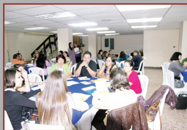
Los participantes del Taller discutieron, en grupos, sobre Trabajo Infantil y Adolescente.

Con el objetivo de sensibilizar y capacitar sobre trabajo infantil y adolescente a los funcionarios del MTSS y otras instituciones p ú b l i c a s responsables