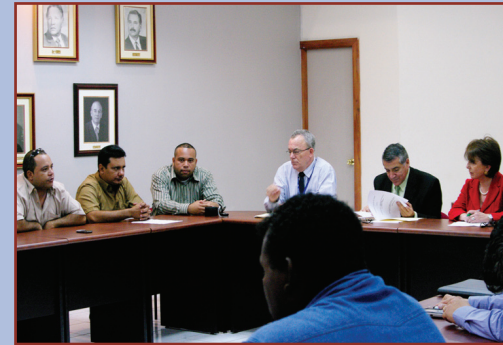
Reunión de personeros de la Standard Fruit Company y jefes del Ministerio de Trabajo.

“Para el Ministerio de Trabajo este arreglo realmente satisface una preocupación que se tenía, y es que precisamente