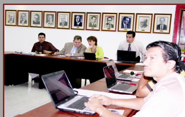
Las mesas de diálogo seguirán en sesiones semanales todos los lunes.

El diálogo entre el Gobierno, a través de la Ministra de Trabajo y Seguridad Social, con los representantes del Sindicato de