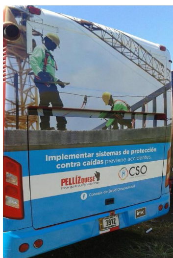
9 - Nicoya

Publicaciones: Como parte de las acciones de divulgación se incorpora la publicación de documentos, en el primer semestre del 2016 se imprimieron 2000 ejemplares del documento: Salud Ocupacional en la agricultura: Principales aspectos técnicos-jurídicos